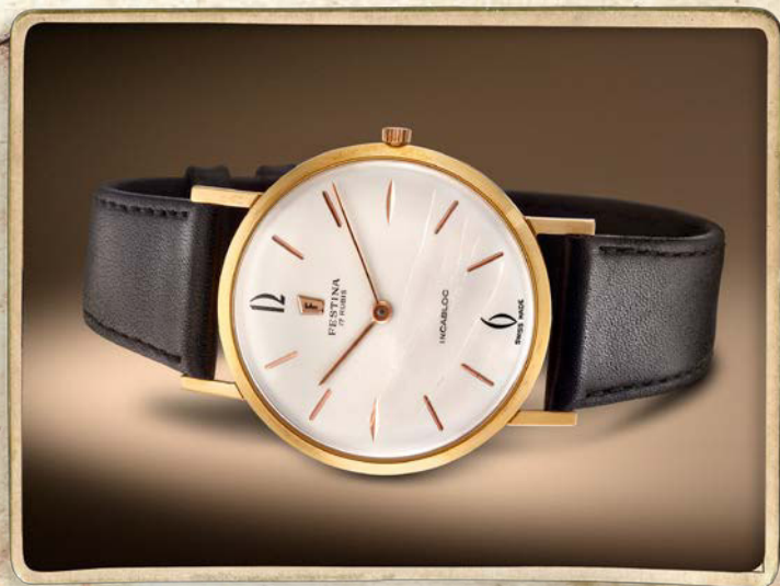
Die Uhr aus dem Jahr 1948.

Die Extra Kollektion. Eine Neuausgabe der prestigeträchtigen Modelle aus dem Jahr 1948.